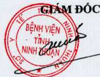
Thái Phương Phiên